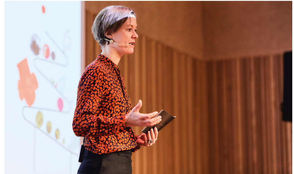
Kultur- og likestillingsminister Anette Trettebergstuen holder innlegg under lanseringen av det nye Balansemerket.