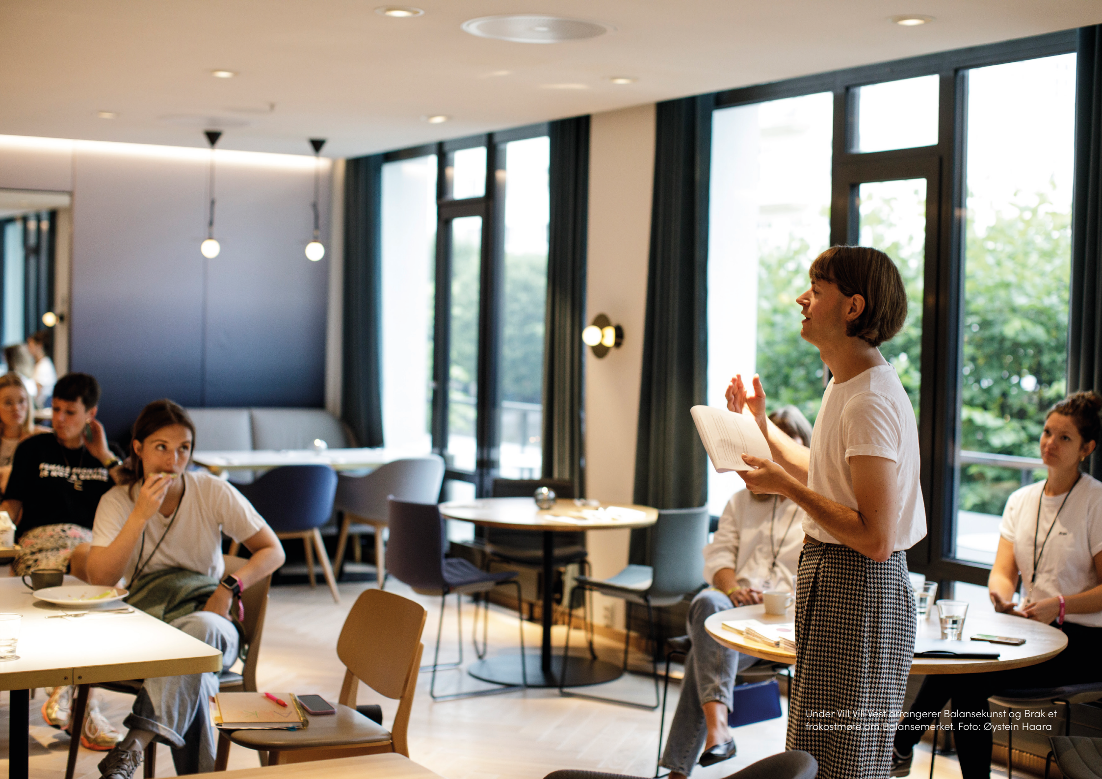
Under Vill Vill Vest arrangerer Balansekunst og Brak et frokostmøte om Balansemerket.