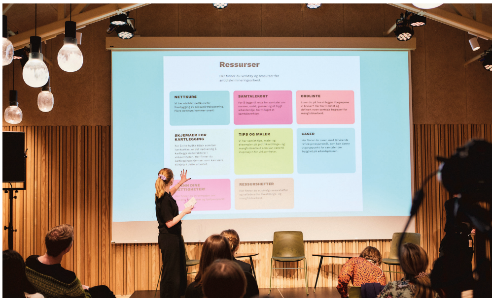
Prosjektleder i Balansekunst, Victoria Øverby Steinland, presenterer Balansemerkets nettressurser.